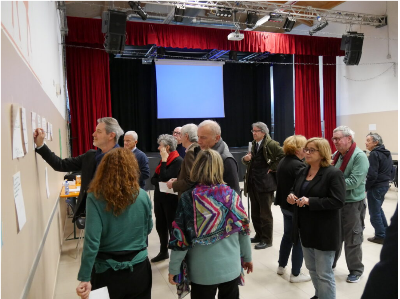
L'iscrizione ai temi/gruppi