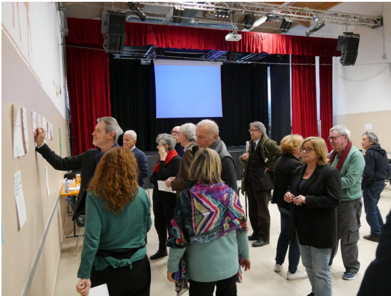
L'iscrizione ai temi/gruppi