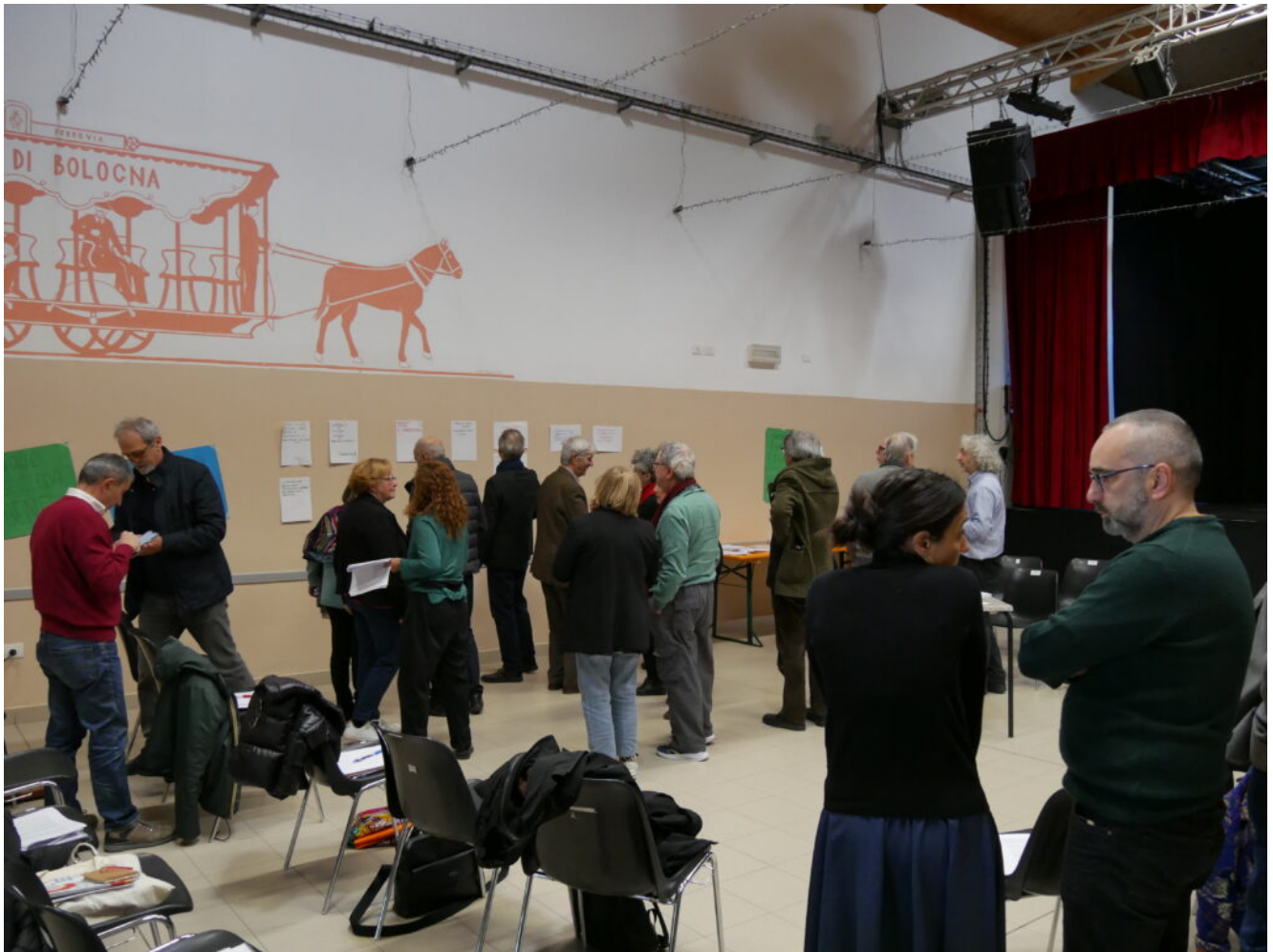
La scelta dei temi e dei gruppi con la metodologia dell'Open Space Technology